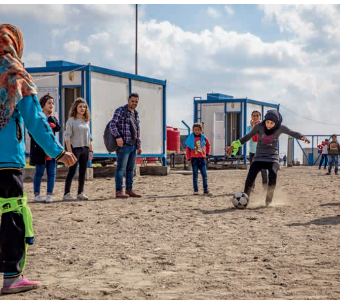
Kinderen voetballen en doen creatieve activiteiten in een vluchtelingenkamp in Noordoost-Syrië